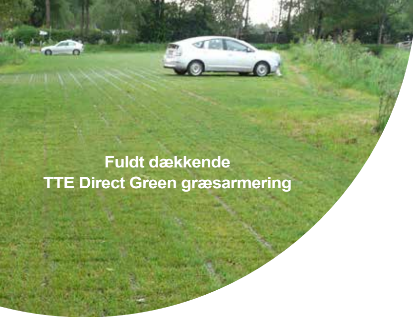
Fuldt dækkende TTE Direct Green græsarmering