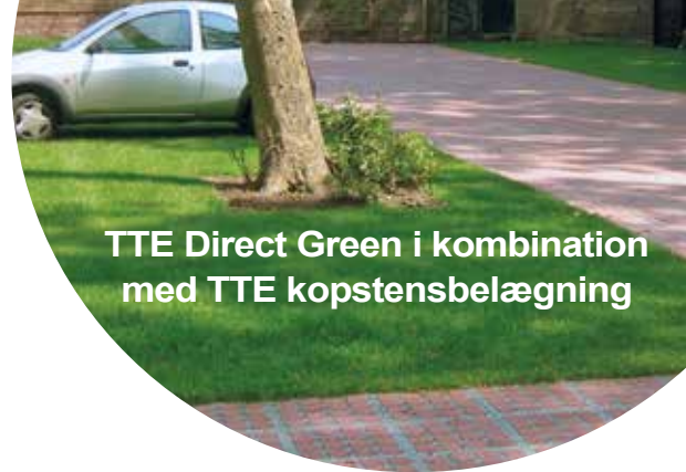
TTE Direct Green i kombination med TTE kopstensbelægning